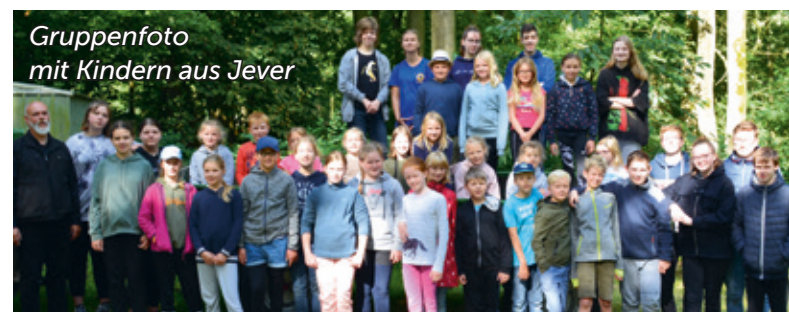
Gruppenfoto mit Kindern aus Jever