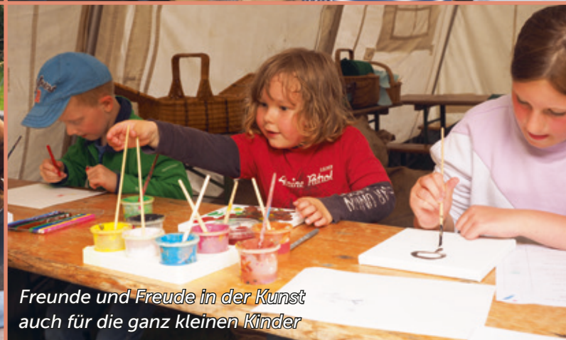
Freunde und Freude in der Kunst auch für die ganz kleinen Kinder