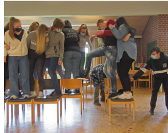
Teamer bewegen sich