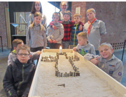
Pfadfinder ermuntern zum Glauben

wünschen den Schülerinnen und Schülern unserer jeverschen Schulen, den Kolleginnen und Kollegen im Schuldienst und den Eltern eine gute Mitte, denn letztlich bestimmen wir die Mitte und natürlich alles Gute zum Schulstart unseren