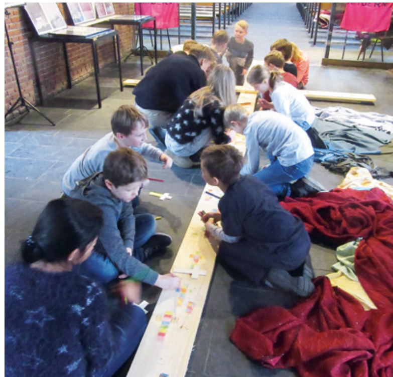
Eine Stunde vor dem Lockdown der Schulen

Einschulungskindern, mit dem Wunsch zu feiern und Gemeinschaft zu haben. Keiner kann sagen, wie das neue Schuljahr wird.