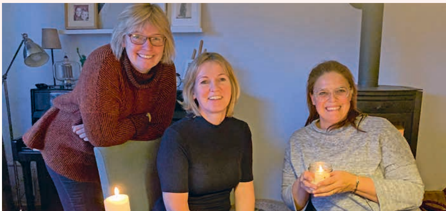
Familie Rocker, Rahrpum