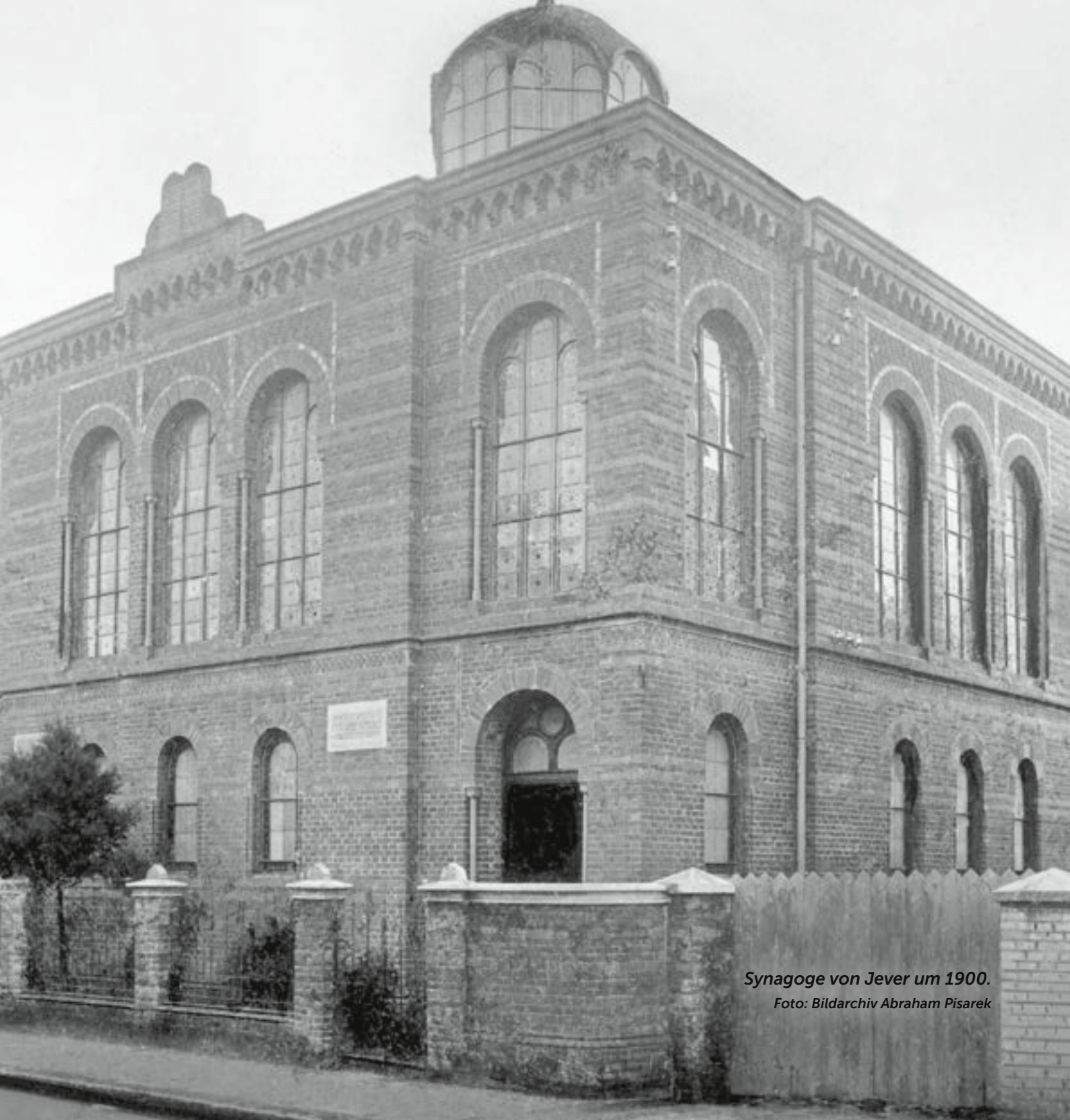
Synagoge von Jever um 1900.