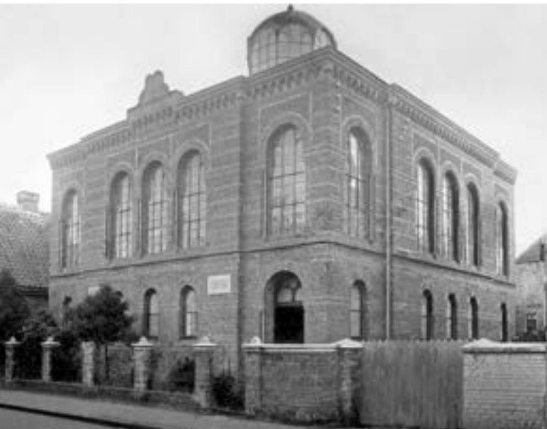
Synagoge von Jever um 1900.

Hier befand sich von 1880 bis 1938 die Synagoge der Stadt, wohl der bedeutendste Beitrag zur Architektur Jevers am Ende des 19. Jahrhunderts. Die 200 jüdischen Jeveraner hatten ihr kleines Gotteshaus von 1802 durch eine prächtige Synagoge im damals aktuellen maurischen Stil ersetzt. Der Kunstmaler Carl Sonnekes zeichnete den schönen Neubau. Das einzige bisher bekannte Foto entstand um 1900. In einem Kellerraum hinter der Synagoge ist die Mikwe erhalten, das Ritualbad der Gemeinde, und daneben, über den Hof erreichbar, der Anbau mit dem Klassenraum für die jüdischen Kinder.