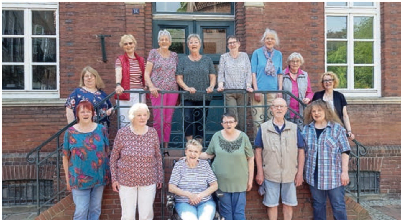
Bei der Aufnahme fehlten einige Mitglieder.

Wir sind nun sechs Jahre alt. Zeit, uns an dieser Stelle wieder einmal kurz vorzustellen: Wir singen zum Lobe Gottes in ökumenischer Gemeinschaft, zu christlichen Festen und Gottesdiensten, und zu unserer eigenen Freude. Auch geselliges Beisammensein und Ausflüge kommen nicht zu kurz. Durch gemeinschaftliche Auftritte mit dem Ökumenischen Singkreis Lemwerder in der Wesermarsch gelang es uns, Chorfreundschaft zu schließen und auch schon gemeinsame Projekte zu verwirklichen, kurzum – wir freuen uns auf mehr. Haben wir vielleicht Ihr Interesse geweckt? Sie müssen keine Künstler sein, Zutrauen zur eigenen Stimme und Freude am Singen reicht schon, denn „Mehr als Worte sagt ein Lied.“ Alle Stimmlagen, jüngeren und älteren „Semesters“, sind herzlich willkommen.